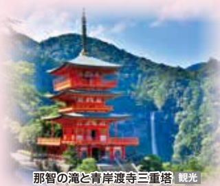
那智の滝と青岸渡寺三重塔 観光

■観覧：熊野那智大社半日観光、熊野古道・大門坂と熊野速玉大社 ほか シャトルバスサービス(予定) | JR紀伊勝浦駅周辺