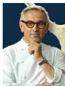
ブルーノ・バルビエーリ BRUNO BARBIERI

イタリア・ボローニャ生まれ。イタリアをはじめ世界の一流レストランでの長年の経験を経て、2011年にはイタリアで最多である計7個のミシュランの星を獲得。メニューのキーワードは「好奇心、創造性、持続可能性」。