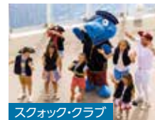
スクォック・クラブ