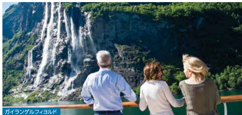
ガイランゲルフィヨルド

氷河が創り出したフィヨルドをはじめ、壮大な大自然に出会う北欧クルーズ。洗練された都市や歴史ある街並みなど、個性豊かな街めぐりも魅力です。