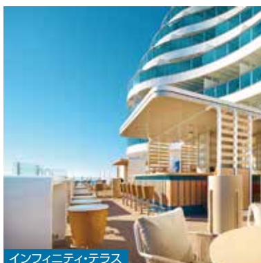
インフィニティ・テラス

眺めのよい船尾の「インフィニティ・テラス」や、アマルフィの太陽にインスパイアされたインテリアの「ソレミオ・ビューティスパ」では、ゆったりとした上質な時間で日常の疲れを癒していただけます。食事を 즐기すぎた後は、海を眺めながらデッキウォークをしたり、ヨガやジム、スポーツコートでエクササイズも。