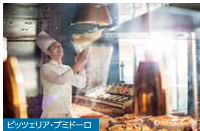
ピッツェリア・プミドーロ