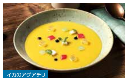
イカのアグアチリ