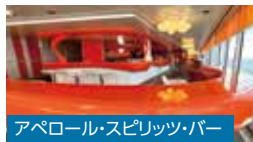
アペロール・スピリッツ・バー

船内には12カ所ものレストランがあり、「アーキペラゴ」ではミシュランシェフの考案したメニューを堪能できます。鉄板焼きやお寿司など日本人にも嬉しいグルメもご用意。ヘーゼルナッツペーストの「ヌテラ」のスイーツ、食前酒で人気の「カンパリ」やスパークリングワインブランド「フェッラーリ」など船内でイタリアの食文化を体験できます。