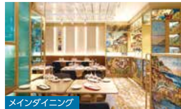
メインダイニング