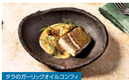
タラのガーリックオイルコンフィ