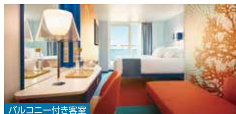
バルコニー付き客室