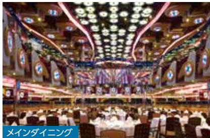
メインダイニング

渡り鳥がコンセプトの美しい装飾やオブジェが印象的。メニューはイタリア料理が中心です