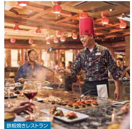
鉄板焼きレストラン

「カルテル」の家具が使われているモダンでエシガントな店内。ゆったりとカプチーノはいかが