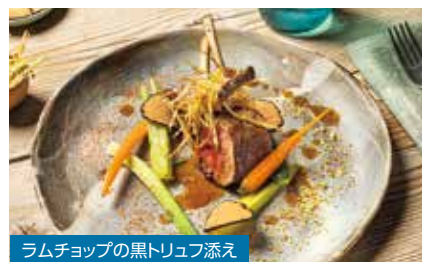
ラムチョップの黒トリュフ添え

1977年スペイン生まれ。2019年にはミシュランサステナビリティ賞を受賞、計4個のミシュランの星を獲得した。料理を通して海の本質を知ってもらうことをモットーとし、「海のシェフ」の称号を得ている。