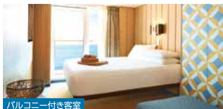
バルコニー付き客室