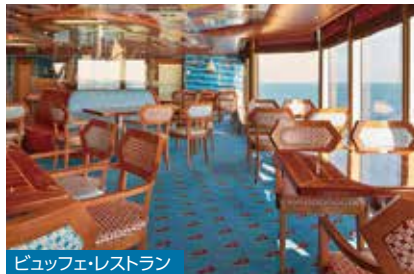
ビュッフェ・レストラン

渡り鳥がコンセプトの美しい装飾やオブジェが印象的。メニューはイタリア料理が中心です