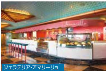
ジェラテリア・アマリーリョ