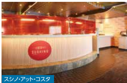
スシノ・アット・コスタ