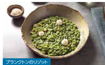
ブランクトンのリゾット