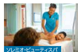
ソレミオ・ビューティスパ