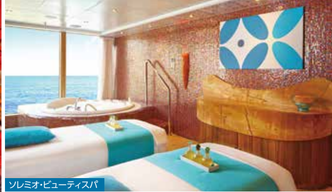
ソレミオ・ビューティスパ