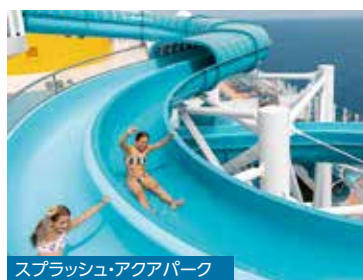
スプラッシュ・アクアパーク