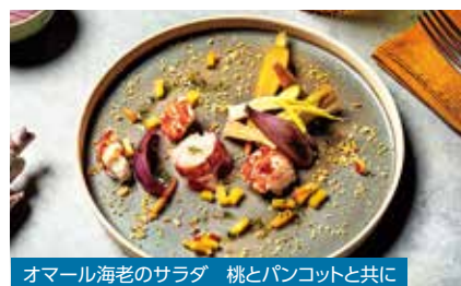
オマール海老のサラダ 桃とパンコットと共に