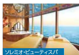
ソレミオ・ビューティスパ