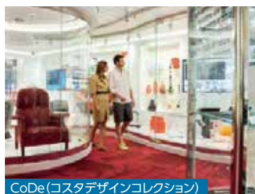
CoDe(コスタデザインコレクション)