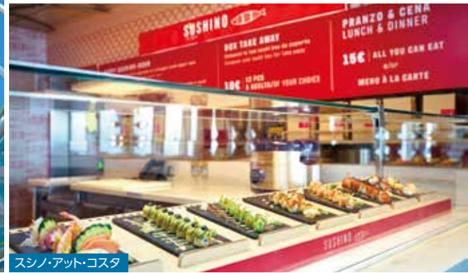
スシノ・アット・コスタ