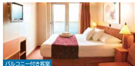
バルコニー付き客室