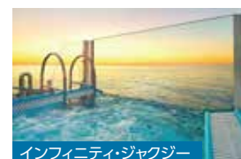
インフィニティ・ジャクジー