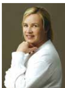
エレヌ・ダローズ HÉLÈNE DARROZE

イタリア・ボローニャ生まれ。イタリアをはじめ世界の一流レストランでの長年の経験を経て、2011年にはイタリアで最多である計7個のミシュランの星を獲得。メニューのキーワードは「好奇心、創造性、持続可能性」。