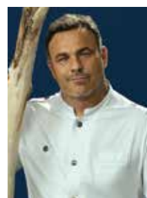
アンヘル・レオン ÁNGEL LEÓN

モナコの名門レストランでキャリアをスタートさせたのち、パリ、ロンドンでレストランをオープン。これまでミシュランで計6つの星を獲得。2015年、ダイナースクラブ®が主催する「ウーヴ・クリコ世界最優秀女性シェフ」に選ばれる。