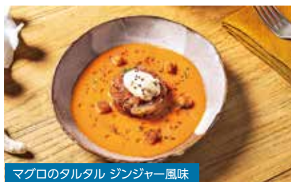
マグロのタルタル ジンジャー風味