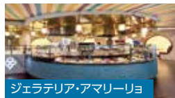
ジェラテリア・アマリーリョ