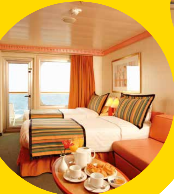
2名1室利用イメージ