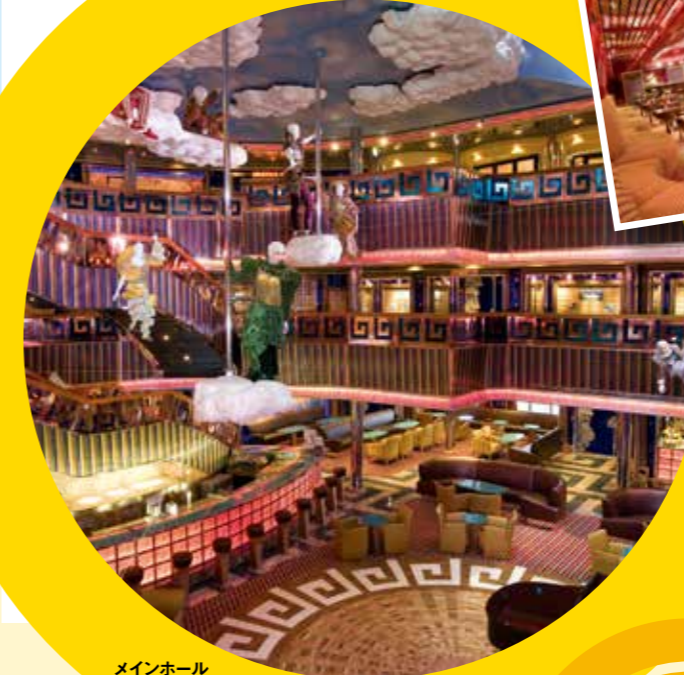
メインホール ギリシャ神話をモチーフにした 華やかな雰囲気を楽しめます。