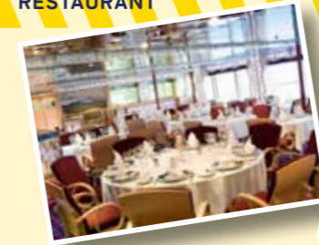
有料レストラン CASANOVA 特別なワンランク上のレストランで、 ゆっくりお楽しみください。