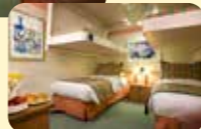
4名1室利用イメージ