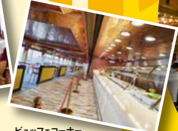
ビュッフェコーナー お好きな時間に自由に 気軽にお食事が出れます。