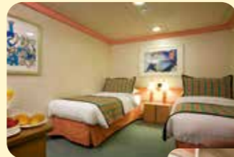
2名1室利用イメージ