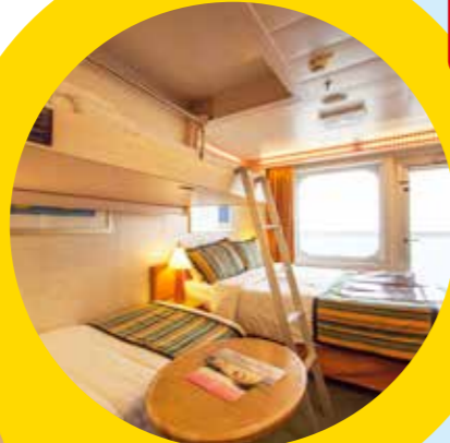
4名1室利用イメージ