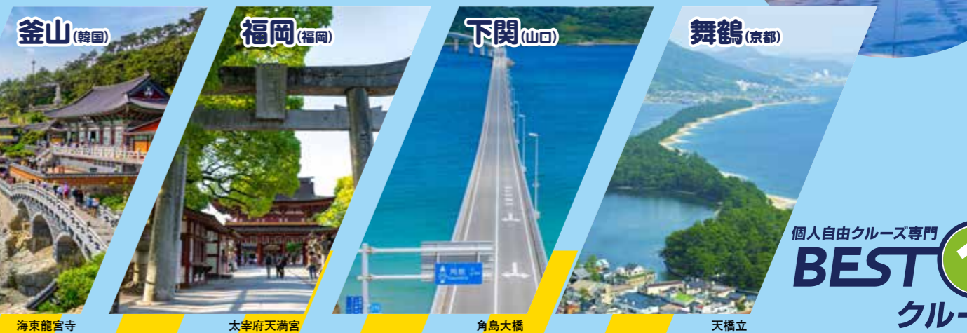
釜山(韓国) 福岡(福岡) 下関(山口) 舞鶴(京都) 海東龍宮寺 太宰府天満宮 角島大橋 天橋立