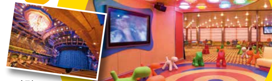
シアター 1,300名収容のシアターでは、 様々なエンターテインメントショーを 鑑賞出来ます。