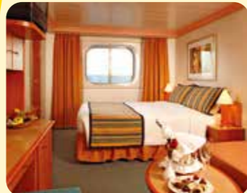
2名1室利用イメージ