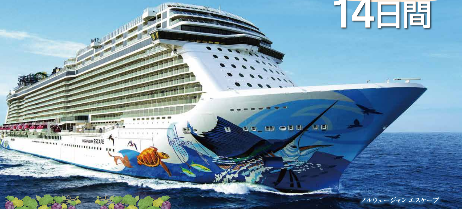
ノルウェージャン エスケープ