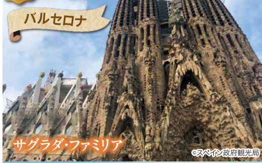
サグラダ・ファミリア