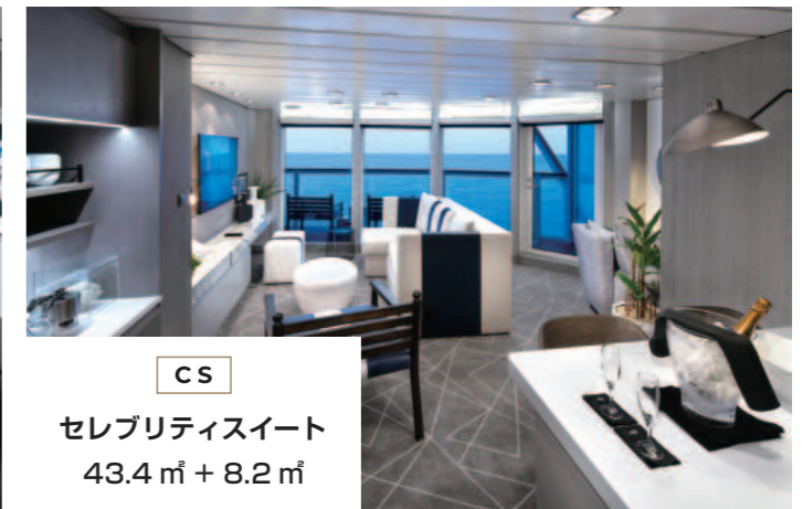
CS セレブリティスイート 43.4㎡ + 8.2㎡