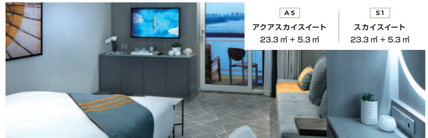
AS アクアスカイスイート 23.3㎡ + 5.3㎡