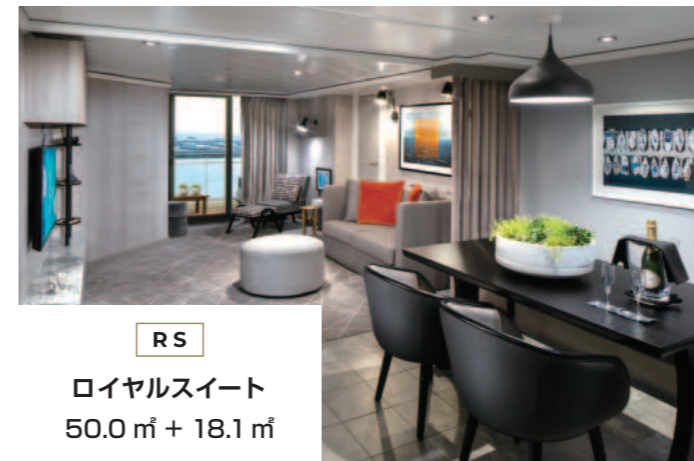
RS ロイヤルスイート 50.0㎡ + 18.1㎡