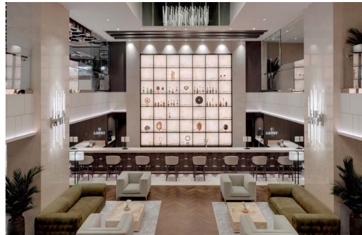
写真左：コンサバトリールプール(エクスプローラI,II)、写真右：ロビーバー(エクスプローラI,II)