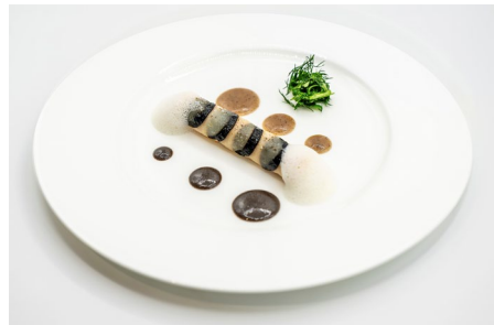
写真上：サクラ 写真下：アンソロジー、ホタテ貝のカネローニ