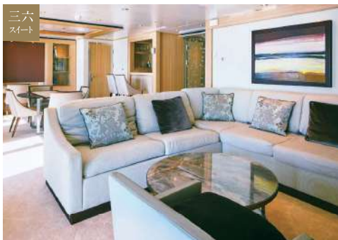
MITSUI OCEAN スイート 82.4㎡ [ベランダ 16.8㎡]

ゆったりとした広さの最上位グレードの客室は、 心身ともにリラックスへと導きます。 ガラス張りのサンルームにビューバスもございます。