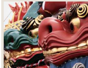
唐津くんちの曳山 (イメージ)

町をあげて受け継がれてきた「唐津くんち」は、ユネスコ無形文化遺産に登録された、躍動する日本文化。曳山を曳く力強さと、囃子の響きに宿る精神性が、世代を超えて息づいています。今回の寄港時はお祭りの時期ではありませんが、曳山展示場にてその存在感と美をゆっくりとご覧いただけます。