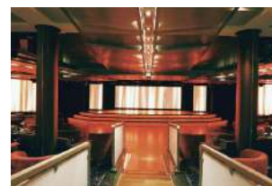
オーシャンステージ