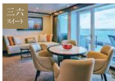
ペントハウススパスイート 48.8~49.4㎡ [ベランダ 15.6~18.2㎡]