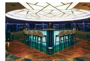
オブザーベーションバー 36