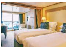
ベランダスイート [A~F] 24.4~30.2㎡ [ベランダ 3.1~6.2㎡]