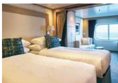
オーシャンビュースイート 25.3~29.4㎡ ※ベランダはありません。