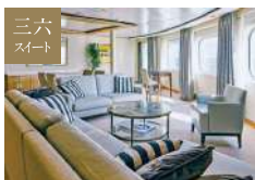
シグネチャースイート 87.0㎡ [ベランダ 55.7㎡]