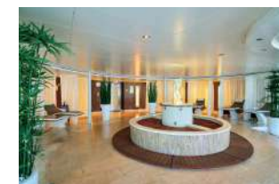
スパ&ウェルネス木霊

※一部のお酒・ソフトドリンクなどは別料金です。 ※船内施設およびサービスの内容は変更になる場合があります。