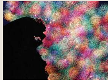
熊野大花火大会 (イメージ)

三百余年の伝統を誇る熊野大花火は、海上自爆や鬼ヶ城の岩壁・洞窟を舞台にした大仕掛けが圧巻。花火が海と山に反響する、熊野ならではの迫力です。混雑を離れた船上から、視界いっぱい広がる光と轟音を、船上からゆったりと味わう特別な一夜をお届けします。(Aコース)