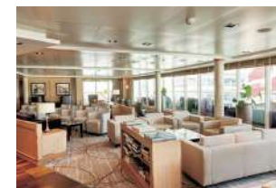
MITSUI OCEAN スクエア