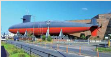
海上自衛隊呉史料館