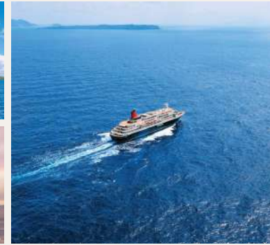
大海原を航行するつぼん丸

上：停泊中の三井オーシャンフジ 下：2026年9月就航予定の三井オーシャンサクラ