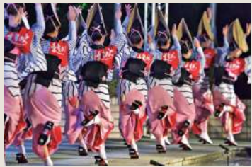
阿波おどり (イメージ)