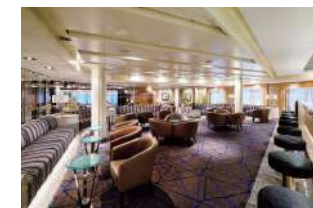
オーシャンクラブ&バー