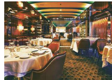
北斎 FINE DINING