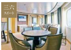
ラグジュアリースイート [A・B] 55.7~87.0㎡ [ベランダ 8.8~36.1㎡]