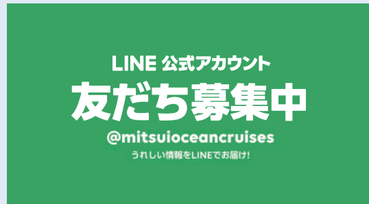
MITSUI OCEAN CRUISES