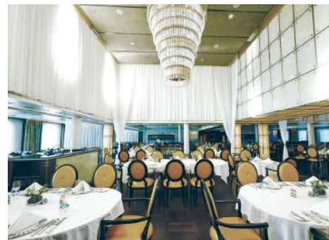
ザ・レストラン 富士