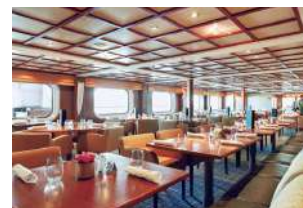
テラスレストラン 八葉