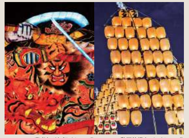
青森ねぶた祭 (イメージ) 秋田竿燈まつり (イメージ)